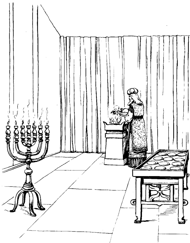
Tiri bozeo lambe dodoma o poronje tebo ŋeha taha bapazi hosâc âsu rikekac

tapa katapa maŋfugnao hetec ŋeha tiri boze motâcte qoruc ââketâc qetickezemec. 6 Qowi bâzi ririkere alata ine tutumaŋ qoruc bozere motâc fugnao hetec ŋezejec. 7 Ƴuzure râqâc sâko ine tutumaŋ qoruc boze â alata ŋonder-ŋekicko hetec ŋeha opâ qatec huzejec. 8 Erâ rârec rârec hae Ƴonare sac bafârehuc motâc-ticnere qoruc qetickezemec. 9 Izi rurua wokemaŋ rorâ tiri boze â maŋnao wiac ŋerakac sasawa i ruacnetec tiri ŋezejec. 10 Qowi bâzi ririkere alata â gie bapare wiac-ticne sasawa i iŋuc jaha wokemaŋ ruacnehuc bâtirizemec, eme alatazi tiri jâmbân ŋezejec. 11 Erâ Ƴuzure râqâc â kikene i iŋuc jaha wâc wokemaŋ ruacnehuc bâtirizemec. 12 Iŋuc erâ Aroŋ â ŋokâfâcne ejaretec ware tutumaŋ qoruc bozere motâcko domahapie opâ rua-jarezemec. 13 Erâ Aroŋ tiri ŋaqi-ticne hecnetec hume wokemaŋ ruacnehuc mufirietecne taha bapa-nane erâ juzejec. 14 Eme ŋokâfâcne jaŋe wâc mutec ware domahapie ŋaqi Ƴora hejaretec huzejec. 15 Eme mamac-ŋerjic wokemaŋ ruacnecmu iŋuc jaha jaŋe wokemaŋ rua-jaretec taha bapafâc-nane erâ junƳepier. Eme wokemaŋ rua-jarehuc miminƳi qâric taha bapa gie forahuc juocte mutara-jarezemec."